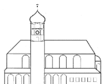
Basilika St. Peter Dillingen

Anmeldung erforderlich jeweils bis spätestens Freitag, 12.00 Uhr, für den darauffolgenden Sonntag.