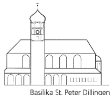
Basilika St. Peter Dillingen

Online unter www.ticket-regional.de/pg-dillingen oder telefonisch unter Hotline 0651 / 97 90 777